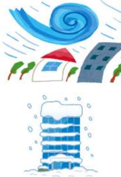
風・雹・雪災、水災による損害共済金の推移

平成26年豪雪による雪災、平成30年7月豪雨による水災、平成30年台風21号及び台風24号による風災といった様々な自然災害が発生し、共済金の支払いが増加していることから、共済掛金率を改定しました。